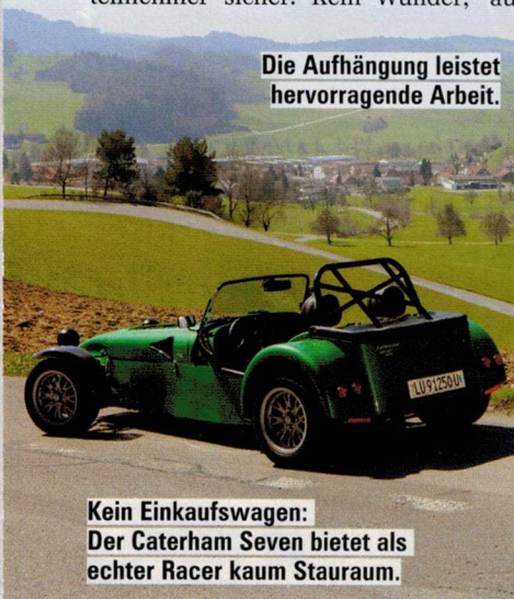
Kein Einkaufswagen: Der Caterham Seven bietet als echter Racer kaum Stauraum.